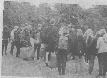
Familiens kuffert skulle stæbes rundt på hele turen og måtte ikke sættes ned. Det gav eleverne en oplevelse af at bære rundt på en tysk flygtningens liv.